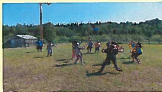
Participants au jeu Ultimate frisbee lors de la visite de la Caravan RLS