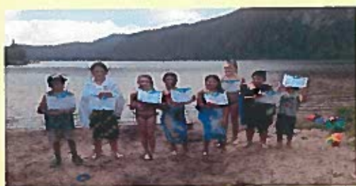
Félicitations aux jeunes de Rivière-Éternité pour avoir réussi la norme «Nager pour survivre !»

Pour les inscriptions ou informations, veuillez communiquer avec Stéphanie Houde au (418) 272-2055 ou Danielle Simard (418) 272-1412.